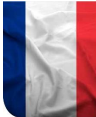
André D'Halluin Vier eeuwen vrouwen rond de macht in Frankrijk

Ludieke voordracht rond de invloed van de vrouwen op de Franse politiek, van de 17 e eeuw tot de 21 ste eeuw.